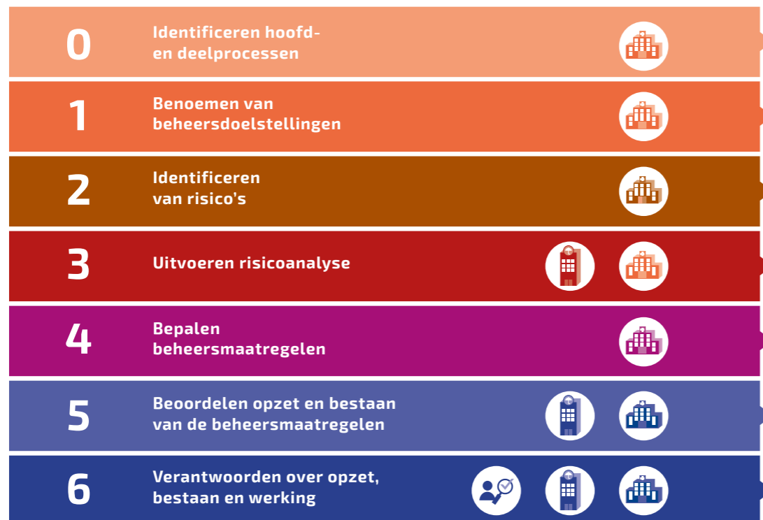
Figuur 1: processtappen control framework

In stap 4 van het Control Framework (Bepalen beheersmaatregelen) bepaalt de zorgaanbieder welke maatregelen hij/zij treft om de geïdentificeerde risico's in het proces te beheersen.